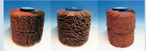
FAPI-FLEX (Standard) FAPI-FLEX COARSE FAPI-FLEX SHINE